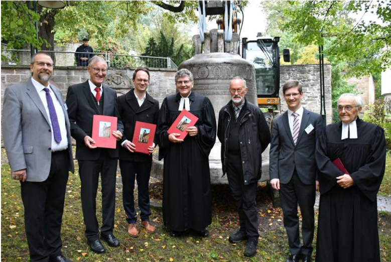
Übergabe der Exposés zum Brandschutz im Glockenmuseum an die Vertreter von Landkreis, Stadt und Landeskirche

Dem persönlichen Austausch der zahlreichen Gottesdienstbesucher, Mitglieder und Freunde des Vereins wurde beim anschließenden Mittagessen im Dekanats Hof Raum gegeben.